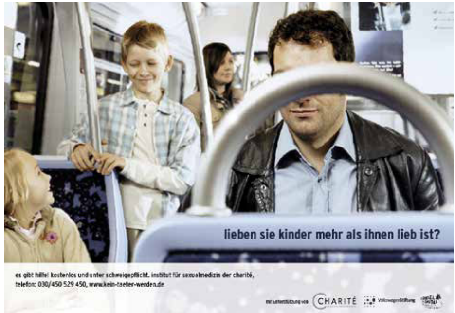
Plakat der Medienkampagne „lieben sie kinder mehr, als ihnen lieb ist?“

Um die Zielgruppe zu erreichen, wird bereits seit Projektbeginn mithilfe einer Medienkampagne auf die Möglichkeit der Beratung sowie auf das therapeutische Angebot aufmerksam gemacht. In Zusammenarbeit mit der Kinderschutzorganisation „Hänsel+Gretel“ und der renommierten PR-Agentur „Scholz & Friends“ entstand 2005 die erste Medienkampagne „lieben sie kinder mehr, als ihnen lieb ist?“