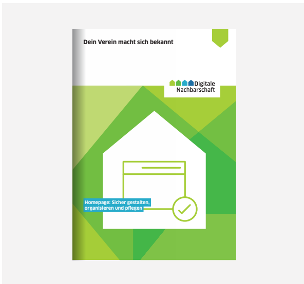
DiNa-Handbuch „Homepage: Sicher gestalten, organisieren und pflegen“