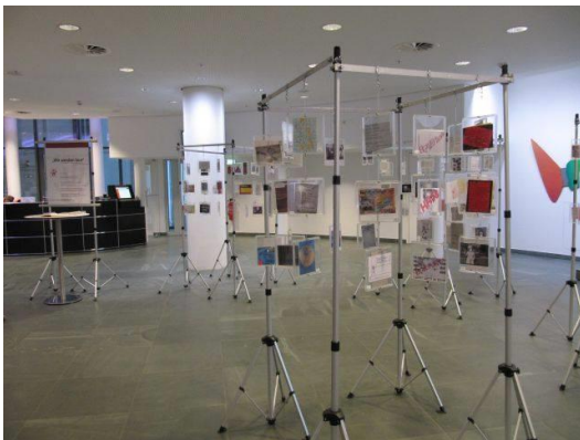
Bild 2 - Freistehendes Ausstellungssystem

Tipp: Falls wenig Platz oder Zeit zum Aufbau vorhanden ist, bietet sich auch unsere Posterversion (s. Bild 3) zum Ausstellen an.