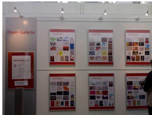
Bild 3 - Posterversion