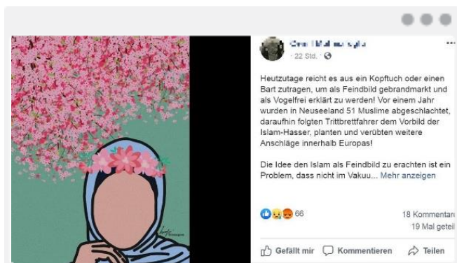
Alltäglicher Rassismus und rechtsextreme Hetze bis hin zu Gewalt werden von Betroffenen als Folge eines übergreifenden „Feindbildes Islam“ gedeutet.