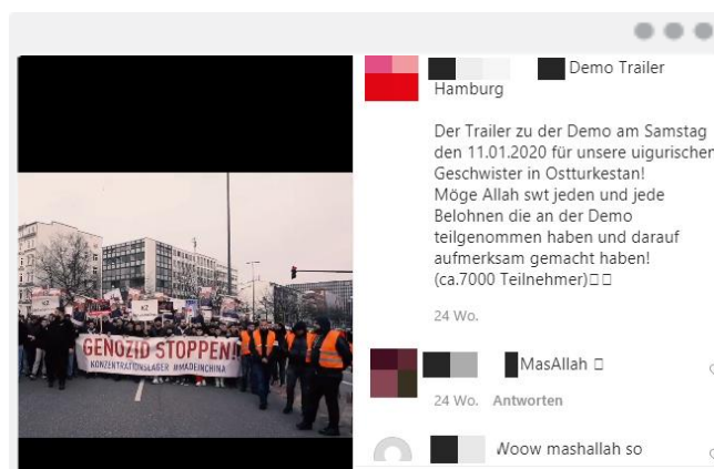
Aufruf zur Demonstration unter dem Motto „Genozid stoppen! Konzentrationslager #MadeInChina“ (Januar 2020). Viele junge Menschen folgten.

nutzt sie, um für eigene Deutungsangebote zu werben. Dies ist besonders paradox, da Antisemitismus selbst oft Bestandteil islamistischer Weltanschauung ist. 1