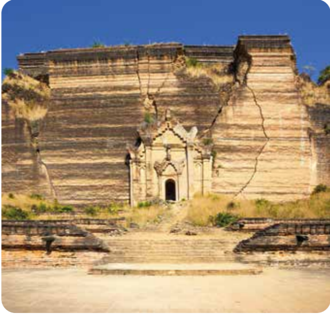
ငလျင်ဒဏ်ခံခဲ့ရသော မင်းကွန်းပုထိုးတော်ကြီး

ငလျင်လှုပ်ခြင်းကြောင့် မြေပြိုခြင်း၊ ရွံ့မီးတောင်များပေါက်ကွဲခြင်း၊ ဆူနာမီနှင့် ရေကြီးခြင်း၊ အဆောက်အဦများပျက်စီးခြင်း၊ လျှပ်စစ်ကြိုးများပျက်စီးခြင်းကြောင့် မီးလောင်ခြင်းတို့ ဆက်လက်ဖြစ်ပွားနိုင်ပါသည်။